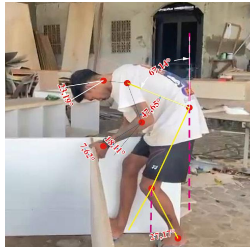
Gambar 4. Perakitan

beban postur yang dialami oleh tubuh. Sehingga didapatkan sudut leher sebesar 23,19^\circ , punggung sebesar 67,14^\circ , lengan atas sebesar 47,65^\circ , lengan bawah sebesar 18,11^\circ , pergelangan sebesar 7,62^\circ dan kaki sebesar 27,17^\circ . Postur tubuh ini menunjukkan posisi kerja yang tidak ergonomis dikarenakan pekerja sangat membungkuk yang dapat meningkatkan gangguan musculoskeletal disorders. Keseluruhan postur pada kegiatan perakitan dengan menggunakan metode REBA bahwa penilaian skor 8 dan termasuk dalam kategori resiko tinggi.