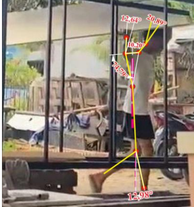
Gambar 2. Persiapan Bahan

Posisi ini memberikan beban otot bahu karena tidak dibantu dengan alat angkat. Posisi kaki pekerja yang membentuk sudut 12,98^\circ dari garis bantu, menunjukkan bahwa adanya penyesuaian beban yang tidak seimbang dan menimbulkan ketegangan pada otot tungkai bawah. Keseluruhan postur dengan menggunakan metode REBA bahwa penilaian skor 7 dan termasuk dalam kategori resiko tinggi.