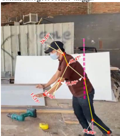
Gambar 3. Pemotongan

Pekerja mebel kayu sedang melakukan kegiatan pemotongan pada papan triplek kayu yang dapat dilihat pada gambar 3. Postur tubuh yang dialami pada pekerja memiliki sudut kemiringan pada bagian leher sebesar 26,10^\circ , punggung sebesar 48,47^\circ , lengan atas sebesar 75,08^\circ , lengan bawah sebesar 23,48^\circ , pergelangan sebesar 13,15^\circ dan kaki sebesar 31,68^\circ . Postur tubuh dalam gambar memiliki posisi membungkuk dengan beban kerja yang menumpu pada kedua tangan di area meja kerja sehingga menimbulkan tekanan berlebih pada punggung, leher dan bahu. Sudut pada bagian tubuh akan digunakan untuk analisis skor REBA dan memperoleh skor total REBA untuk menggolongkan ke tingkat resiko. Keseluruhan postur pada kegiatan pemotongan dengan menggunakan metode REBA bahwa penilaian skor 8 dan termasuk dalam kategori resiko tinggi.