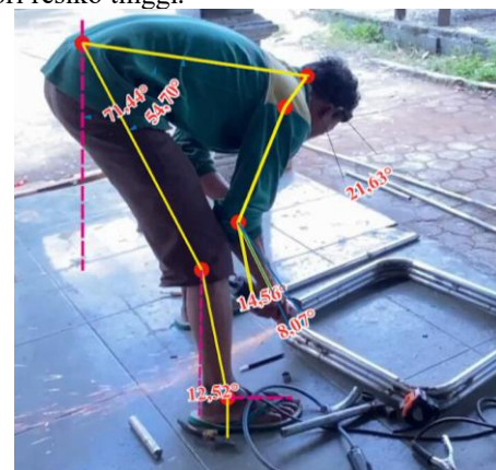
Gambar 5. Pengelasan

Pekerja mebel kayu sedang melakukan kegiatan pengelasan yang dapat dilihat pada gambar 5. Posisi pekerja sangat membungkuk dan menunduk ke arah lantai dan dilakukan penilaian ini dilakukan dengan metode REBA untuk menilai sudut pada bagian tubuh. Sudut yang sudah diukur pada leher sebesar 21,63^\circ , punggung sebesar 71,44^\circ , lengan atas sebesar 54,70^\circ , lengan bawah sebesar 14,56^\circ , pergelangan sebesar 8,07^\circ dan kaki sebesar 12,52^\circ . Postur kerja memiliki posisi yang sangat membungkuk dengan beban yang terdapat di lantai dan punggung yang membungkuk lebih dari 70^\circ mengindikasikan adanya tekanan tinggi pada otot punggung bawah dan bahu. Sehingga keseluruhan postur pada kegiatan pengelasan dengan menggunakan metode REBA bahwa penilaian skor 8 dan termasuk dalam kategori resiko tinggi.