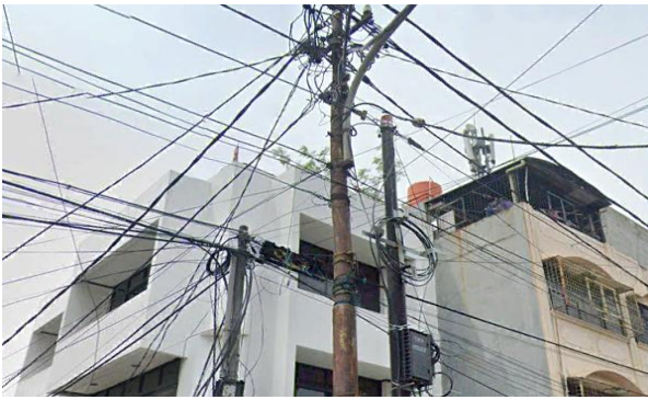
Gambar 1. Kondisi Network system FTTH di Jalan Duri

Pada proyek pemasangan di wilayah tersebut, aspek perencanaan distribusi kabel tidak dipertimbangkan dengan baik selama pelaksanaannya, sehingga biaya pengadaan kabel serat optik meningkat secara signifikan. Hingga saat ini, instalasi kabel serat optik dalam pemilihan rute distribusi umumnya dilakukan dengan menghubungkan kabel langsung dari sentral kantor (STO) menuju rumah customer menggunakan pendekatan one tube one core , dengan tanpa melalui ODC dan ODP [19].