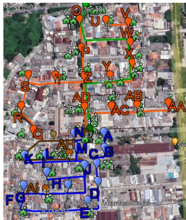
Gambar 2. Lokasi Penelitian

Dalam penelitian ini, jenis kabel serat optik yang digunakan adalah tipe 12 core. Pemilihan jumlah core sebanyak 12 didasarkan pada ketersediaan ODP di lapangan. Peneliti melaksanakan penelitian dengan lokasi berada di Jalan Duri Gambir, Kec. Gambir, di Jakarta Pusat.